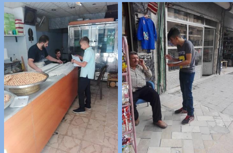
На фото опрос в г. Алеппо.