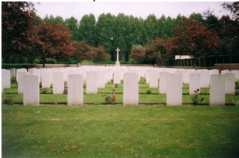
Общий вид кладбища