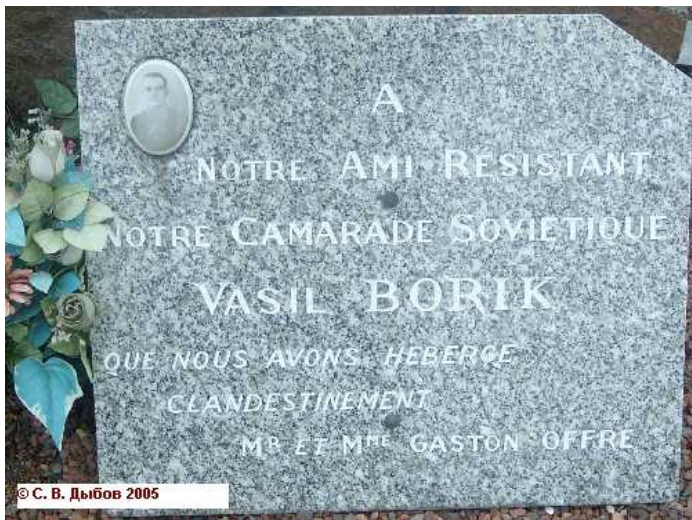
Мемориальная доска от Гастона ОФФРА и его супруги, укрывавших В.Порика во время войны