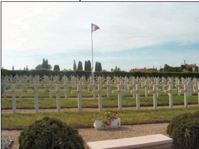
Общий вид военного каре