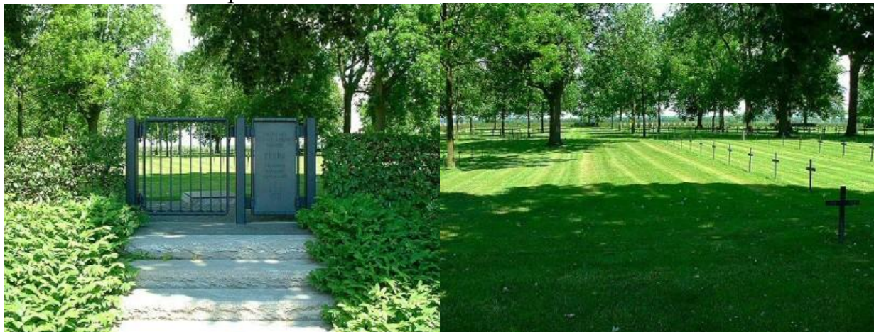
Общий вид немецкого кладбища