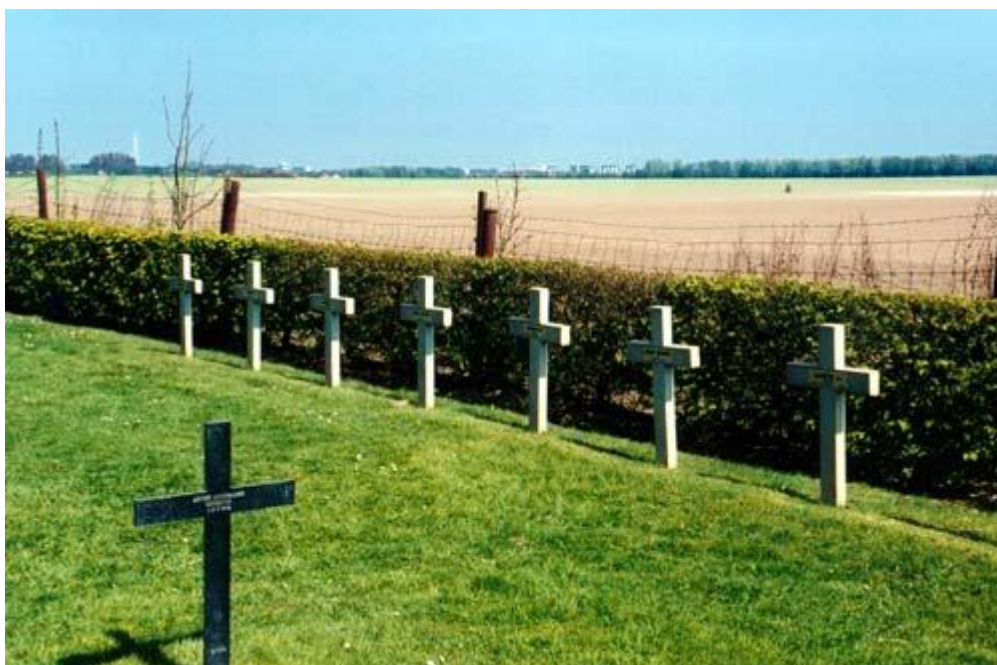
Могилы русских солдат