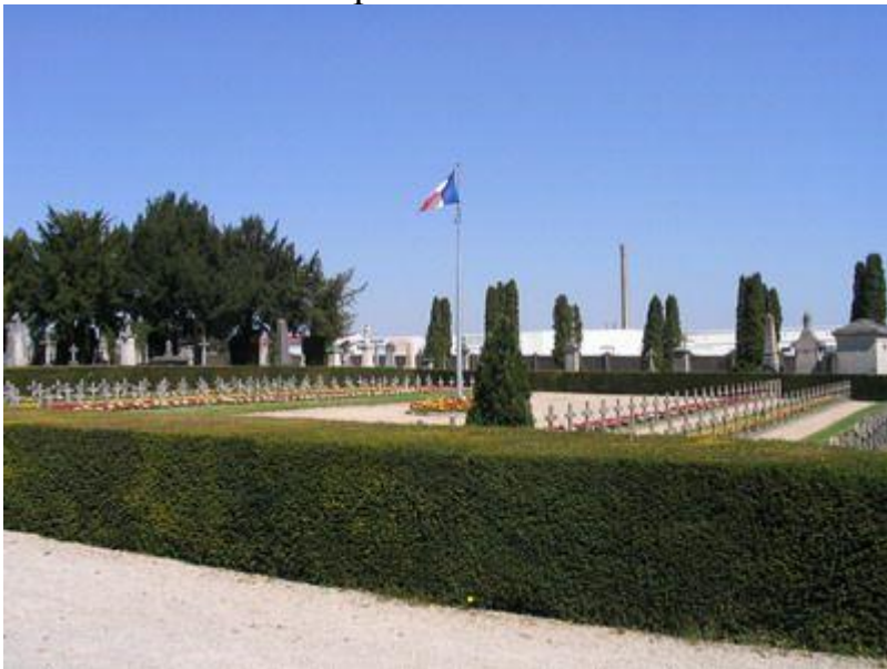
Общий вид военного каре