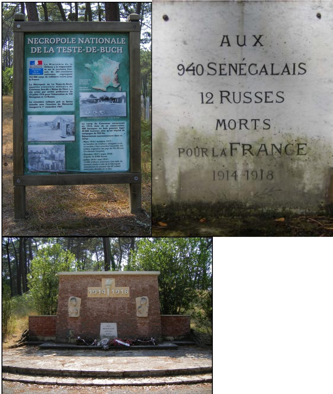
Памятник погибшим сенегальским и русским солдатам