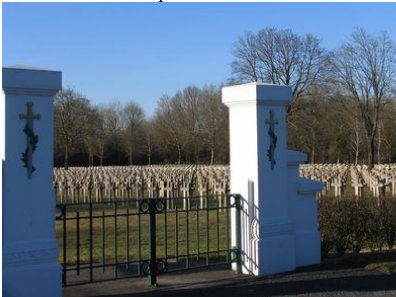
Вход на территорию некрополя