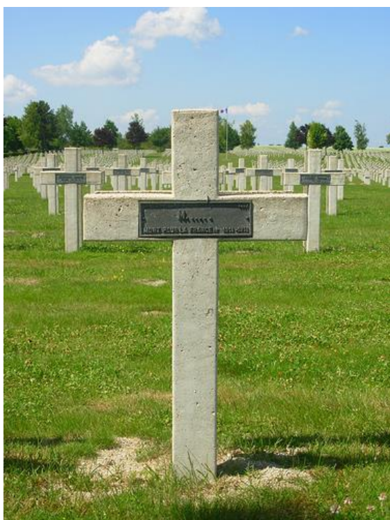
Общий вид захоронений