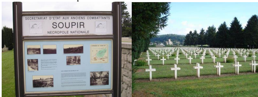
Национальный некрополь Супир № 1