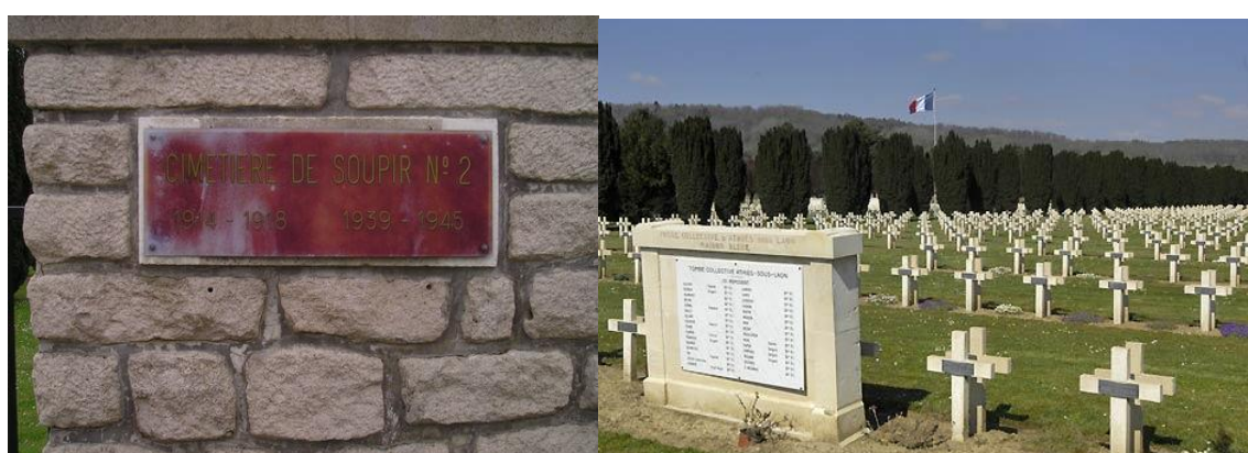
Национальный некрополь Супир № 2