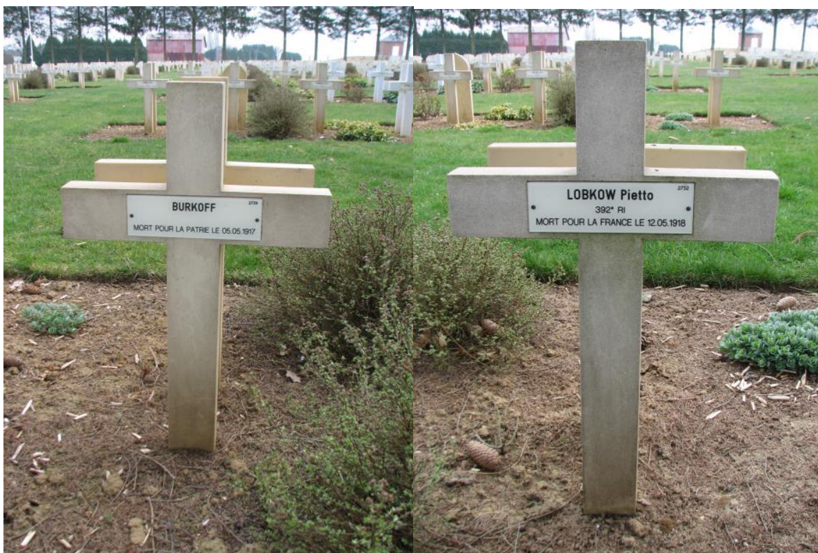
Захоронения русских солдат