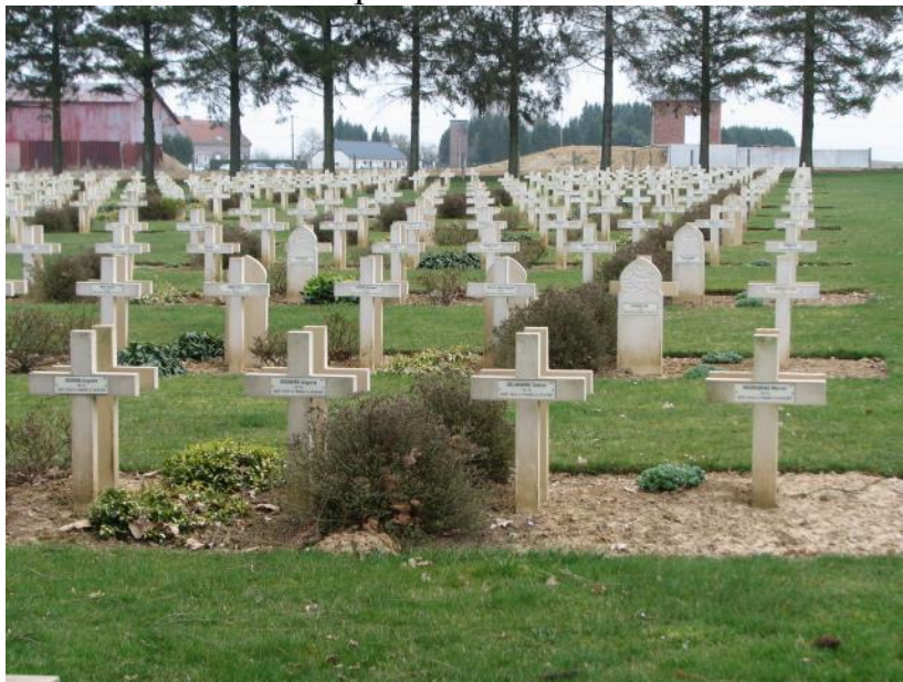
Общий вид кладбища