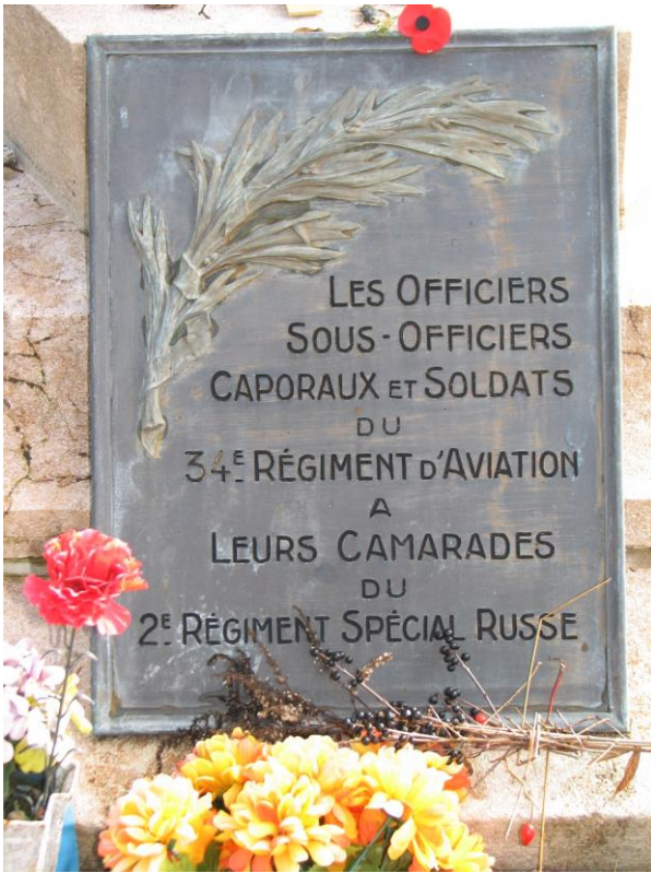
Мемориальная табличка, установленная у подножья памятника французскими военнослужащими расположенной рядом воинской части