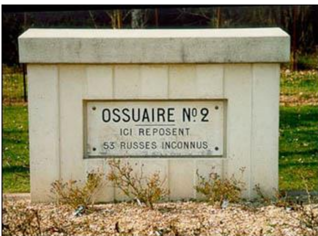
Братская могила № 2 (53 неизвестных русских солдата)