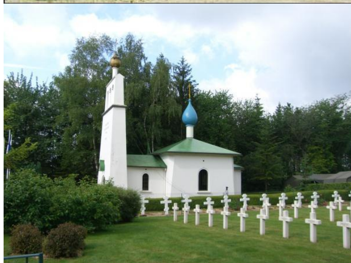
Общий вид кладбища