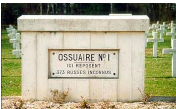
Братская могила № 1 (373 неизвестных русских солдата)