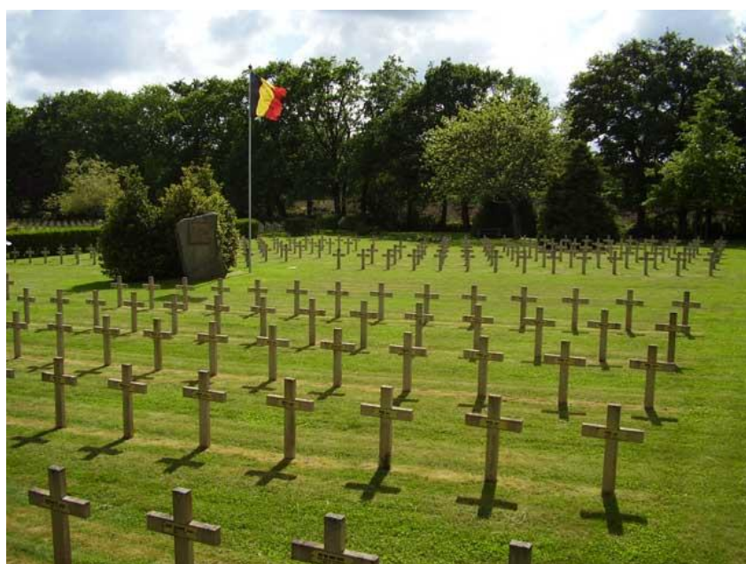
Общий вид кладбища