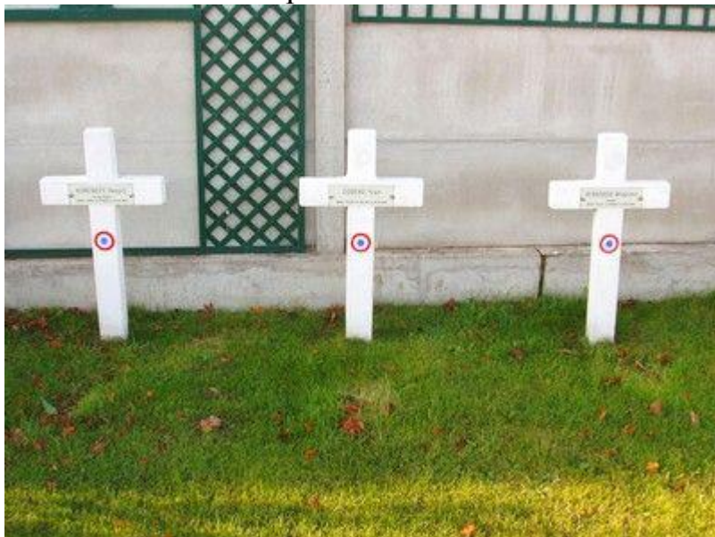
Могилы солдат Русского экспедиционного корпуса