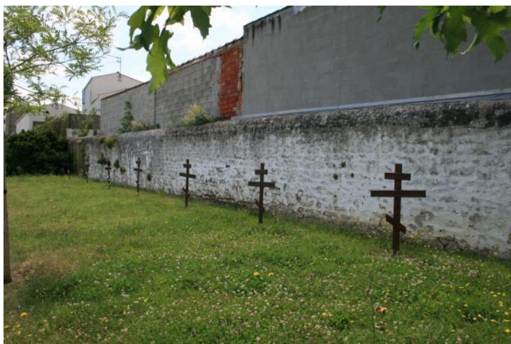
Могилы русских солдат