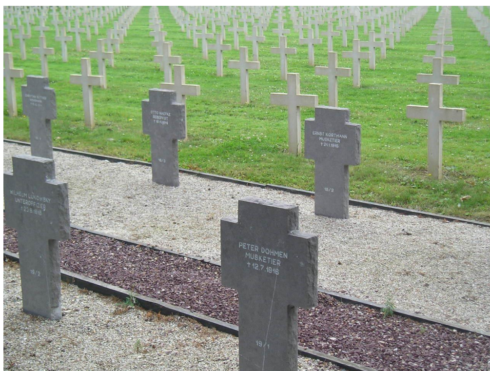
Общий вид военного каре