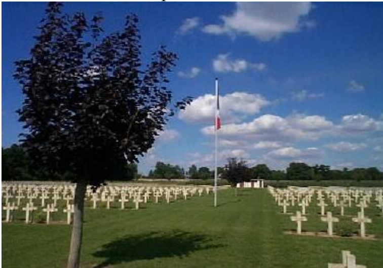
Общий вид кладбища