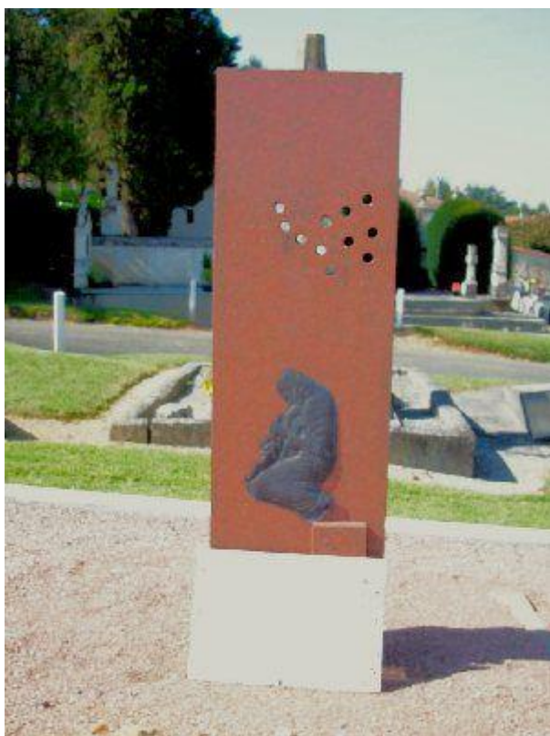
Памятник погибшим на кладбище «Северное» в г. Перигё