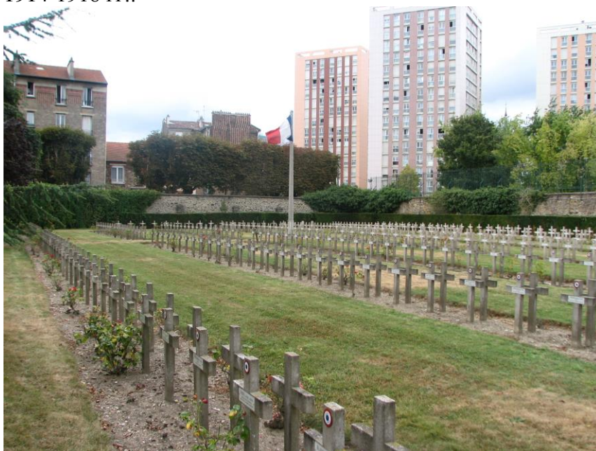
Общий вид каре