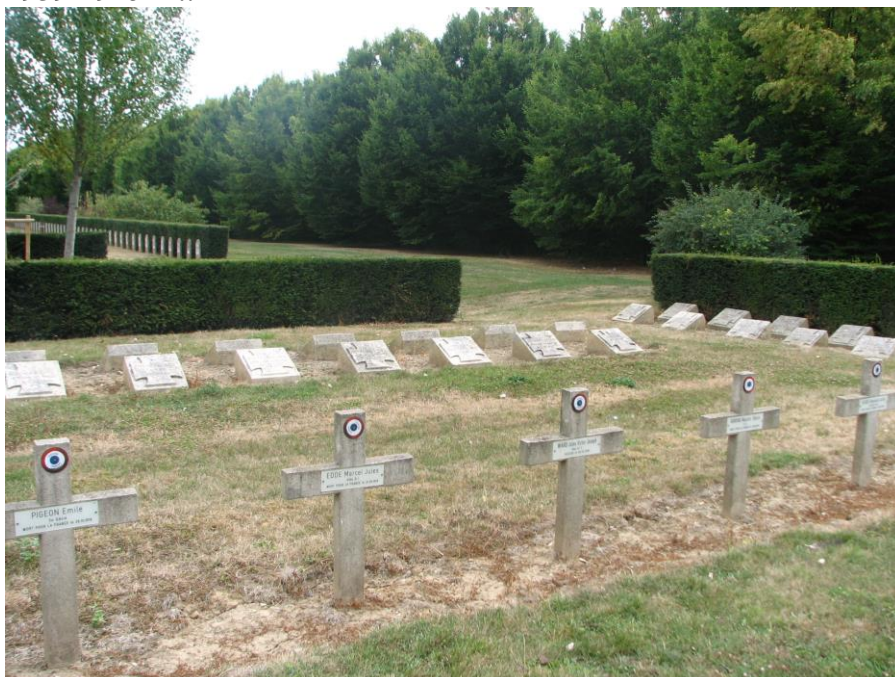
Общий вид каре