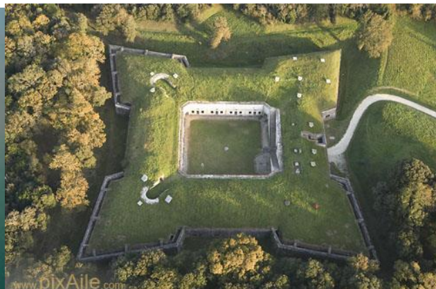
Общий вид форта Льедо.