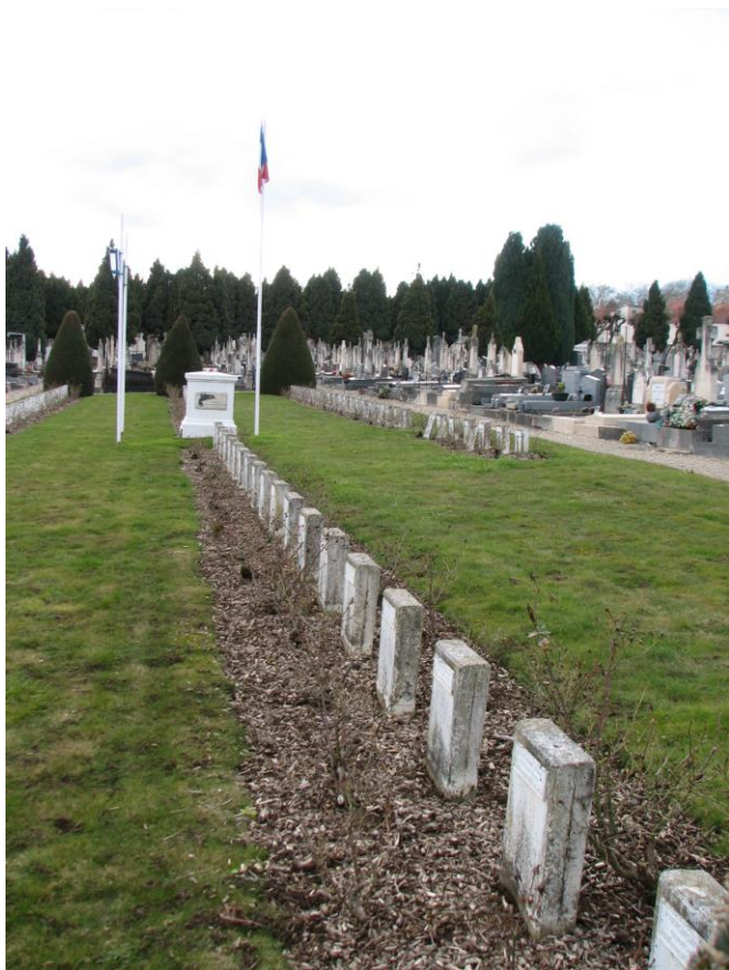
Общий вид военного каве кладбища Сент-Аматр