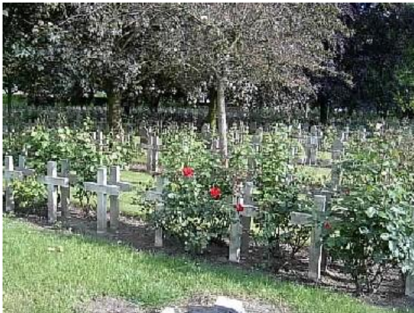
Захоронения русских солдат