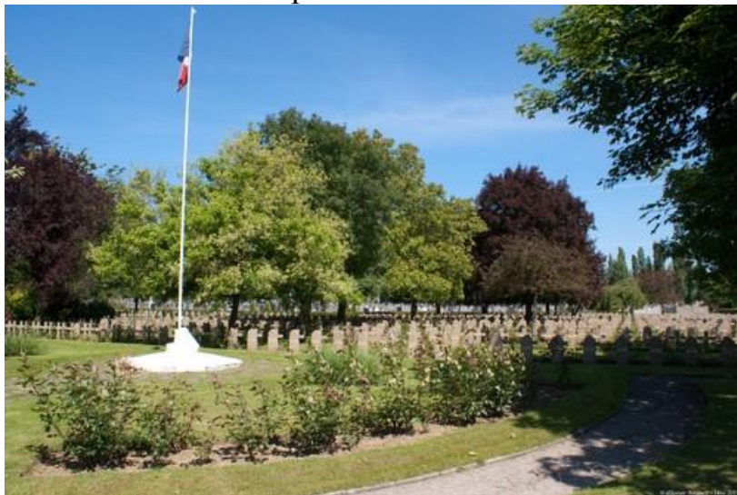
Общий вид кладбища