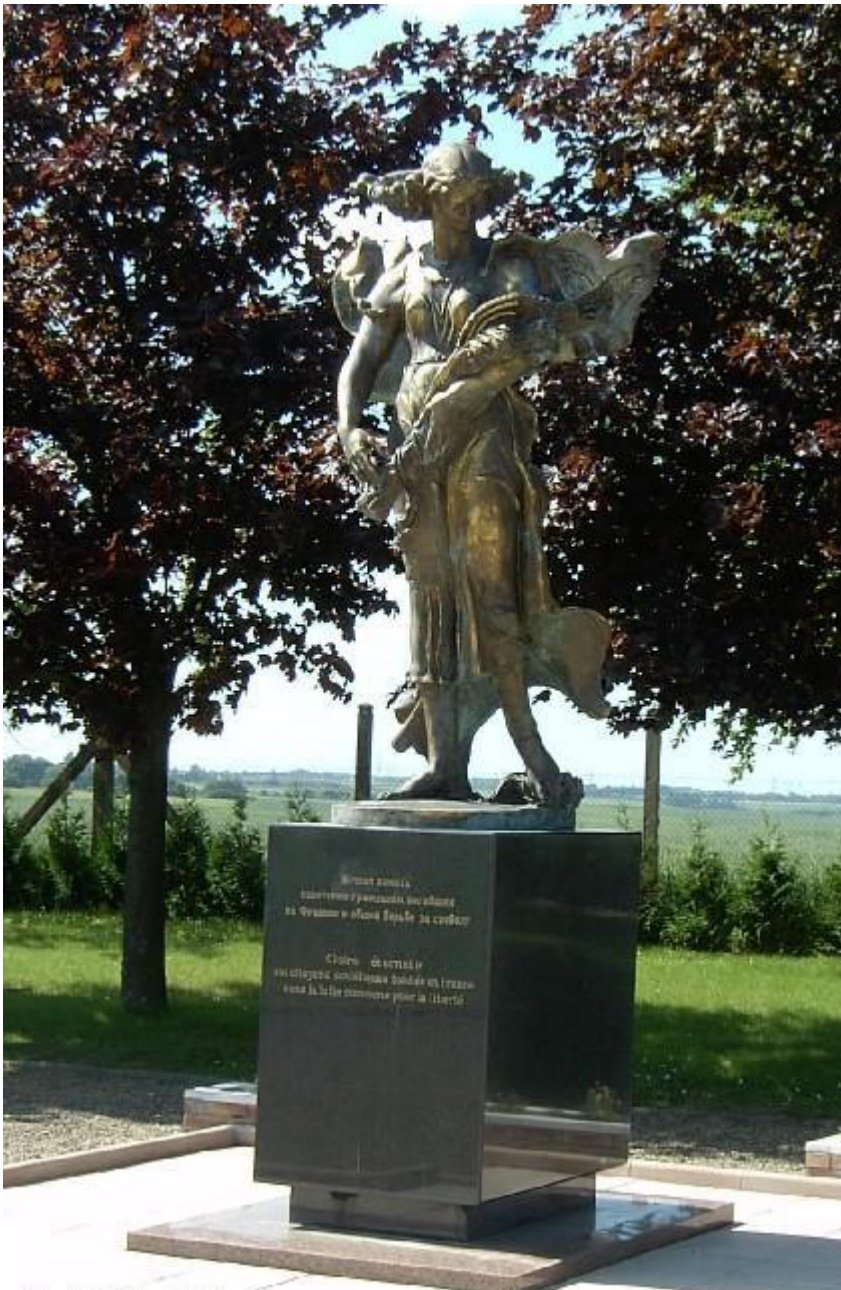
В 2002 году на кладбище был установлен монумент «Цветы России».