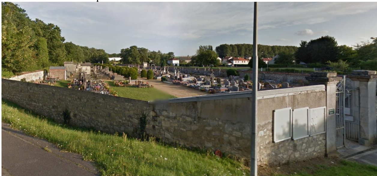
Общий вид кладбища