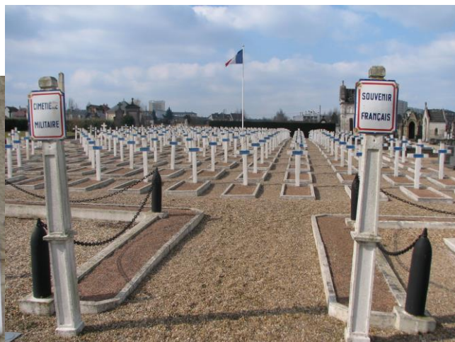
Общий вид военного кадре