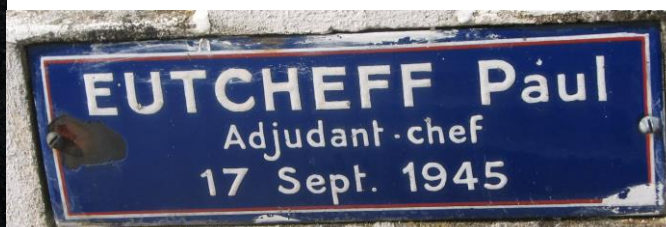
Могилы периода Второй мировой войны