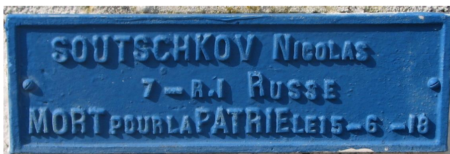
Могилы российских солдат