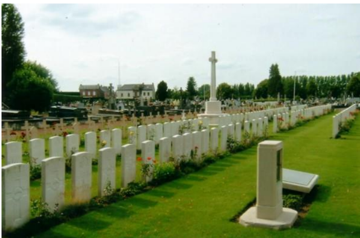
Общий вид кладбища