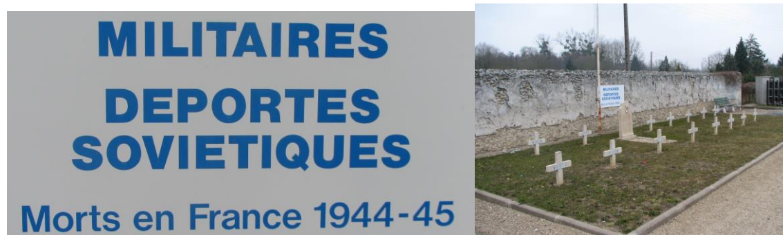
Общий вид военного кадре советских военнопленных Второй мировой войны