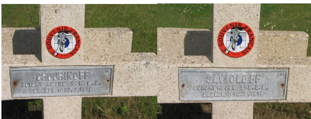
Захоронение солдат Первой мировой войны.