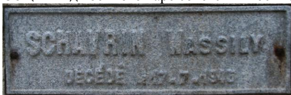
Могила советского солдата