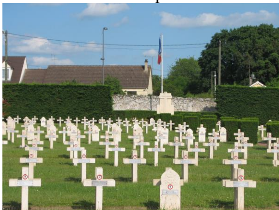
Общий вид военного кадре 1914-1918 гг.