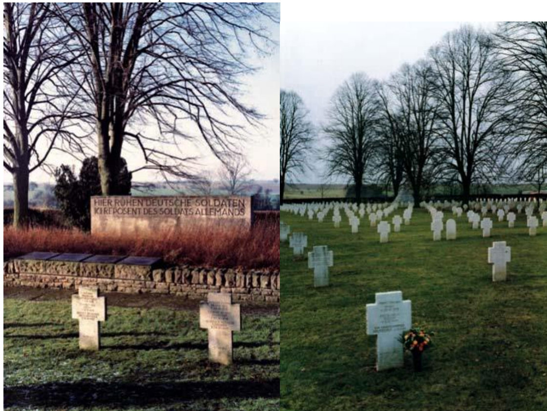
Общий вид немецкого кладбища