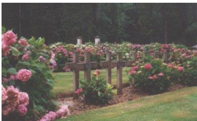
Захоронения русских солдат