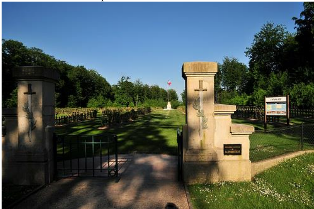
Вход на кладбище «Ла Форестьер»