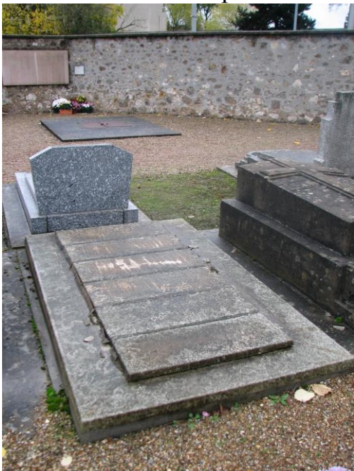
Могила советского солдата