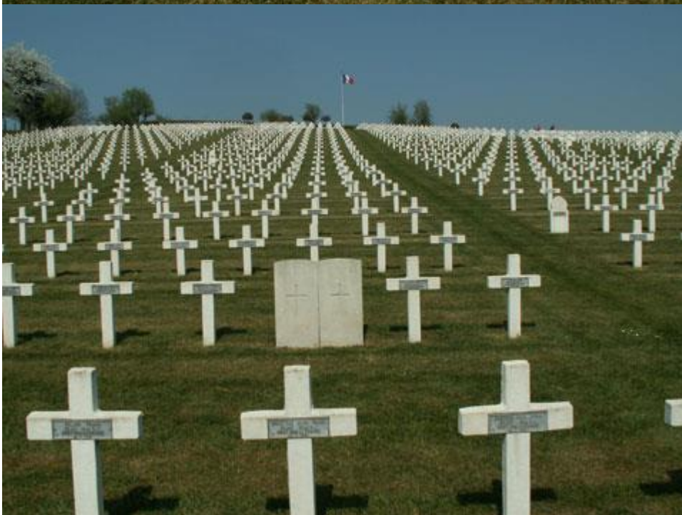
Общий вид кладбища