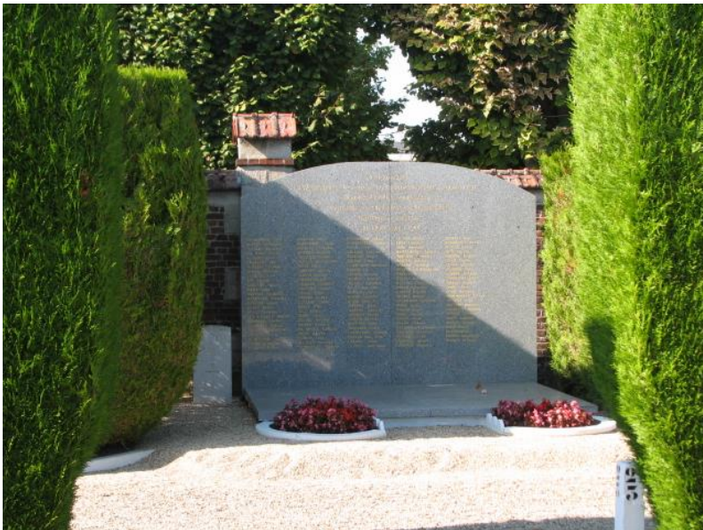
Общий вид братской могилы узников концлагеря