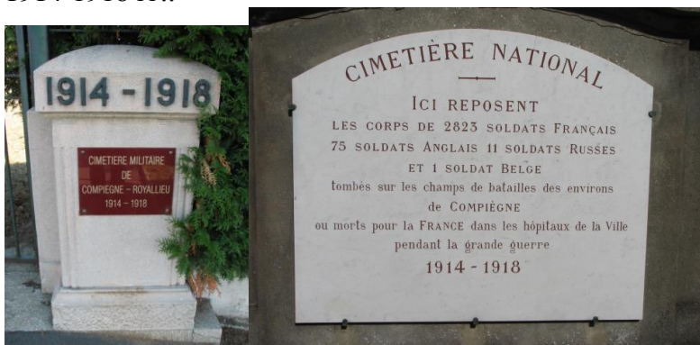
Вход в Национальный некрополь