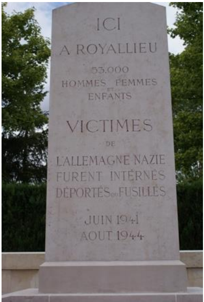
Надпись на памятнике: «Здесь в Руальё 53 тысячи мужчин, женщин и детей – жертв немецкого фашизма были интернированы, депортированы или расстреляны с июня 1941 г. по август 1944 г.»