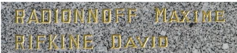
По официальным данным два человека, похороненных в этой могиле, – русские (Родионов и Рифкин)