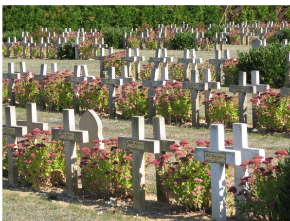
Общий вид кладбища