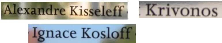
Несколько из многочисленных русских фамилий в списке узников лагеря