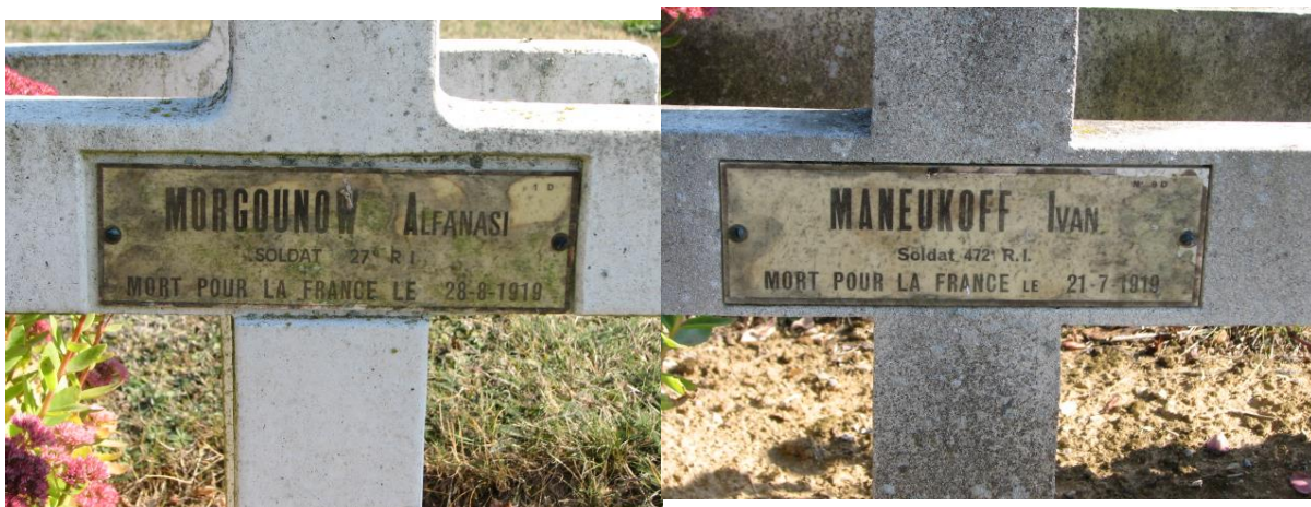
Захоронения русских солдат