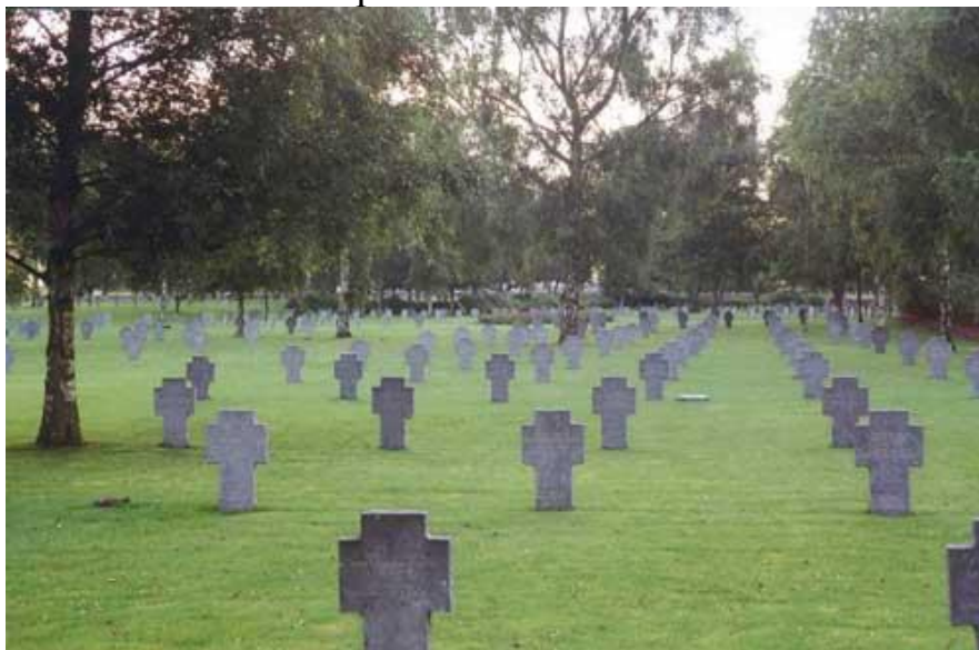
Общий вид немецкого кладбища «л'Облед Поле»