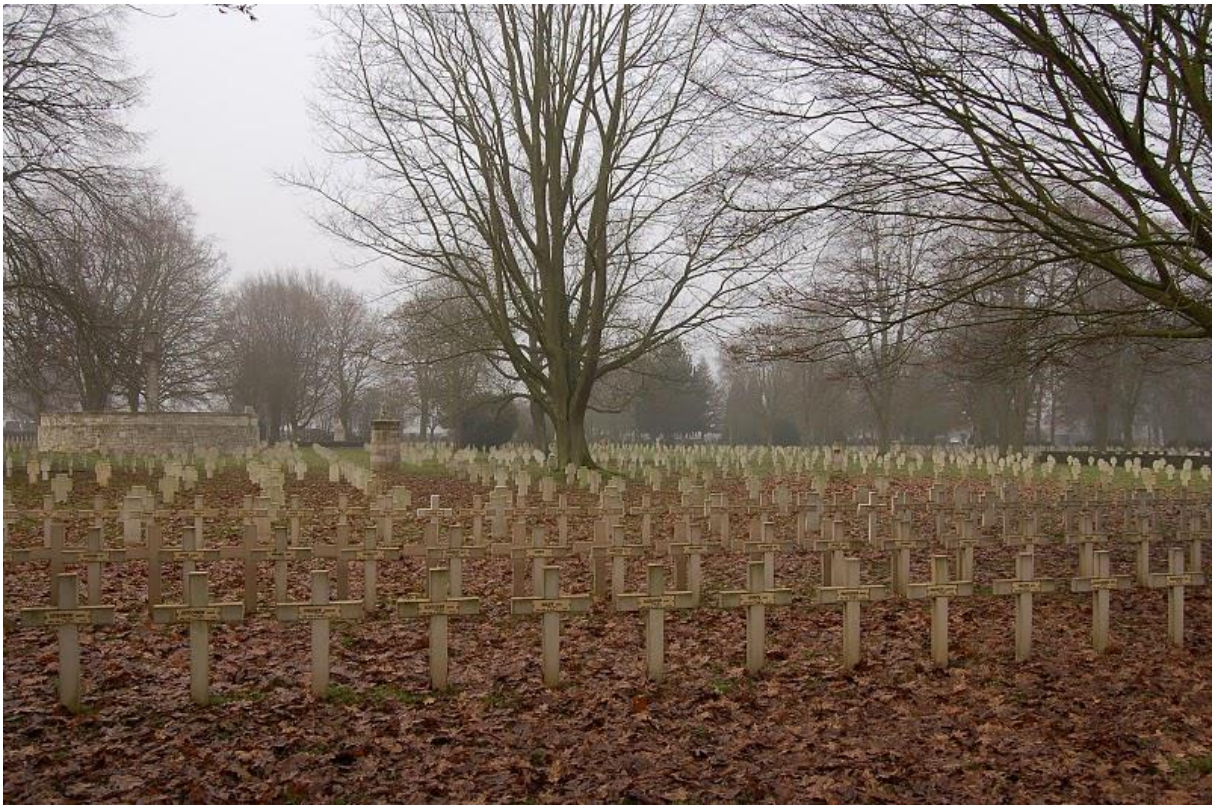
Немецкое кладбище Soldatenfriedhof Cambrai. Могилы русских и немецких солдат