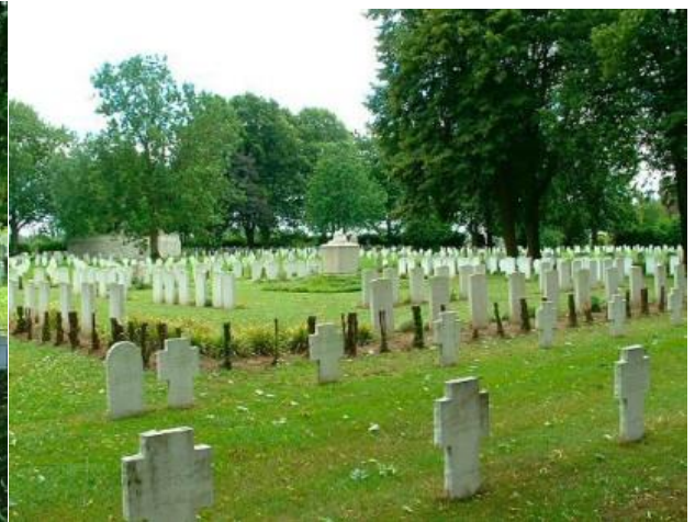
Восточное военное кладбище Камбре