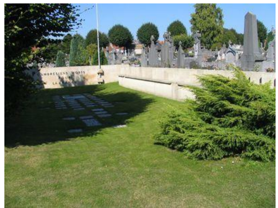
Симетière Militaire de Cambrai Общий вид кладбища