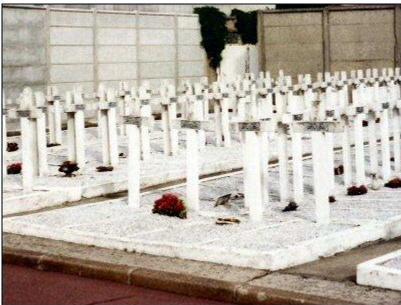
Общий вид военного каве коммунального кладбища