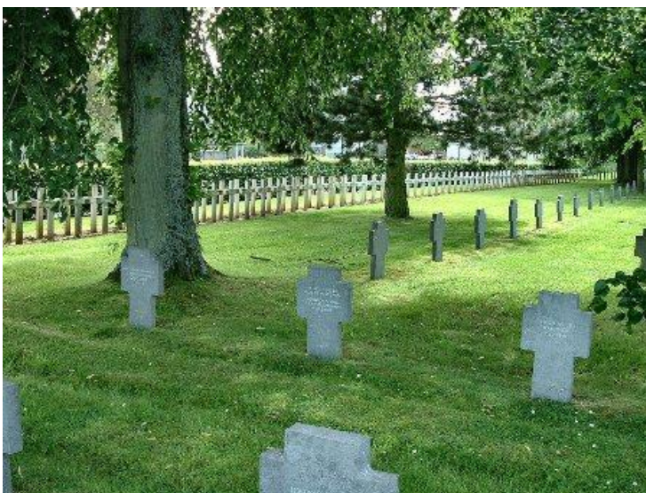
Общий вид немецкого кладбища