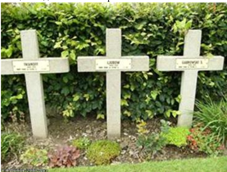
Могилы русских военнопленных