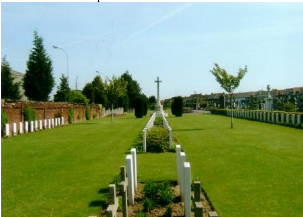
Общий вид военных захоронений