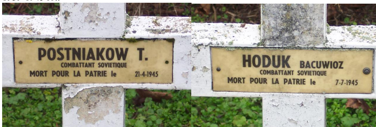
Могилы советских солдат