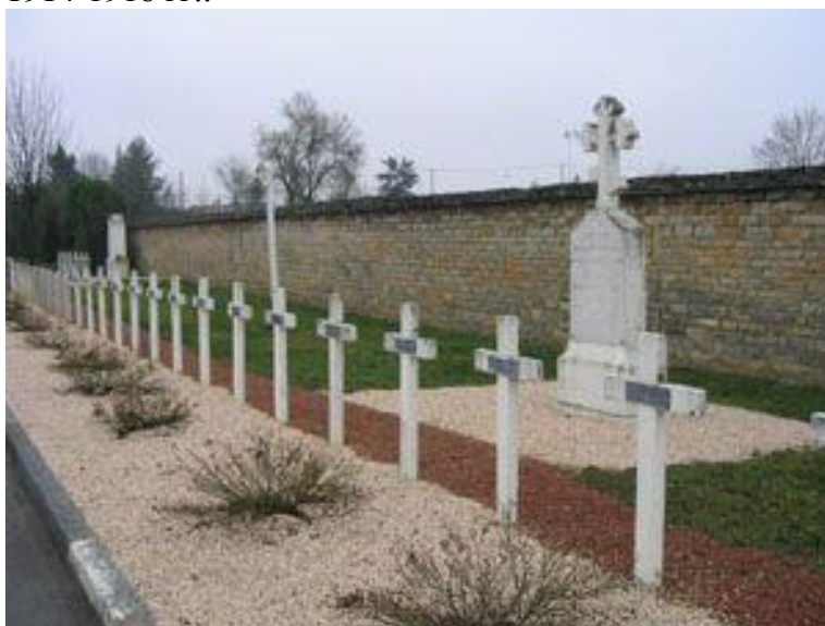
Могилы русских солдат