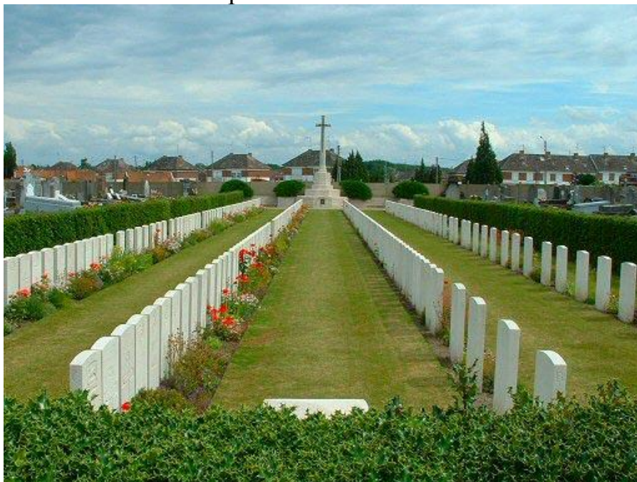
Общий вид военных захоронений