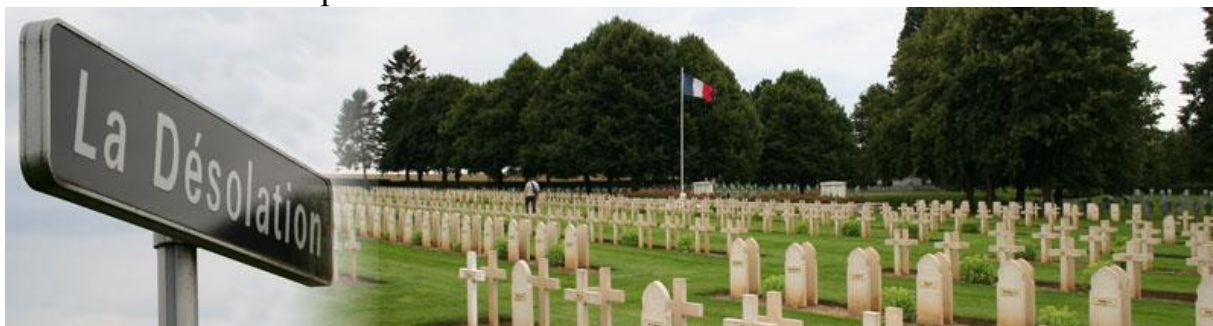
Общий вид некрополя