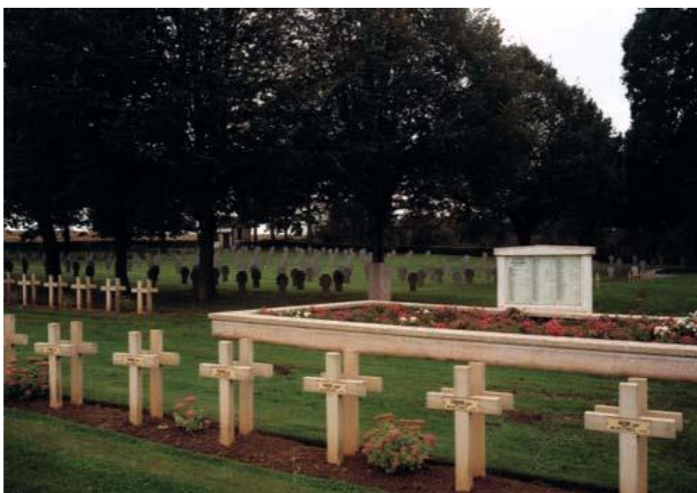
Французские и русские захоронения