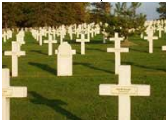
Общий вид кладбища