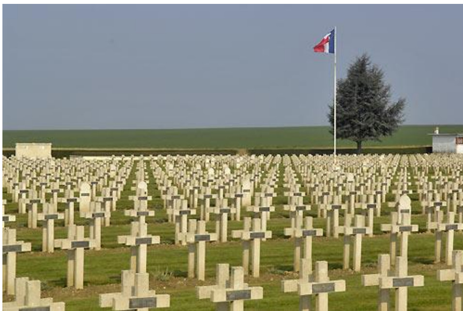
Общий вид французского некрополя