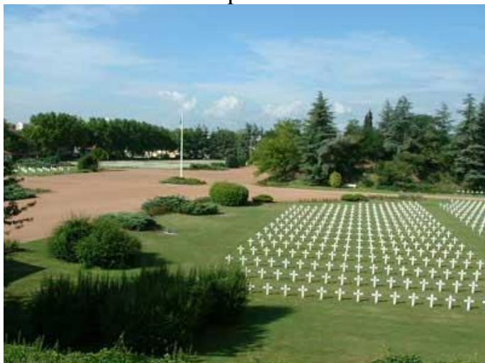
Общий вид захоронения