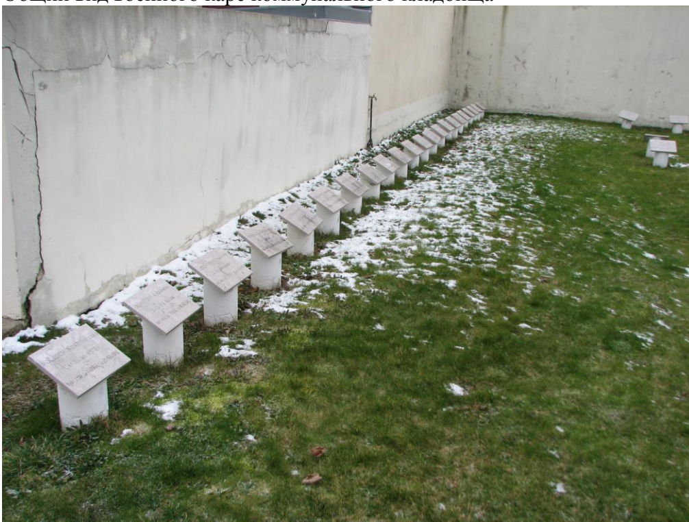
Захоронения российских солдат и офицеров