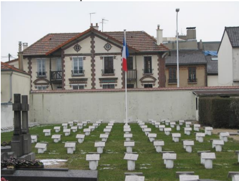
Общий вид военного каре коммунального кладбища