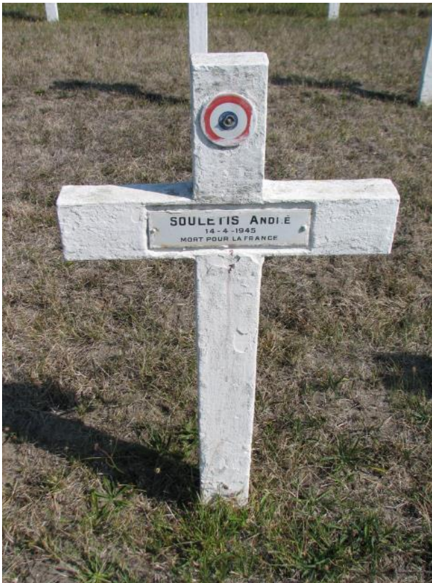
Могила советского солдата