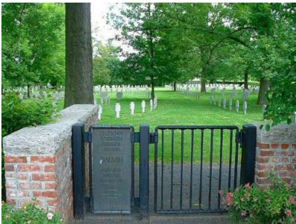
Общий вид кладбища