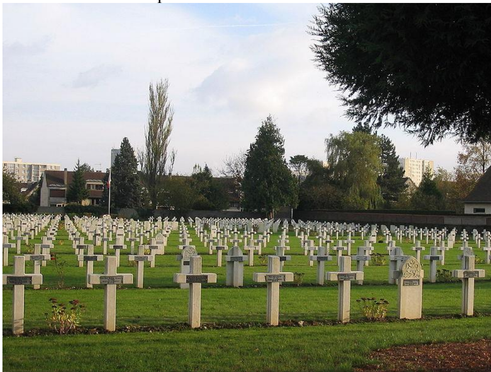
Общий вид кладбища