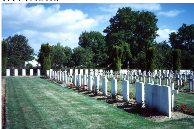
Захоронения союзников на территории Национального некрополя Мариссель. 1939-1945 гг.: