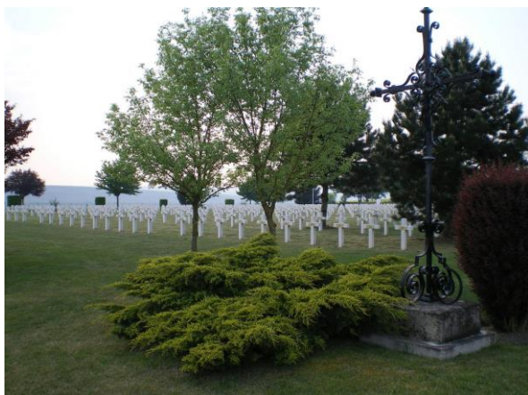
Общий вид кладбища