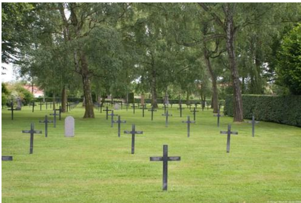
Общий вид кладбища