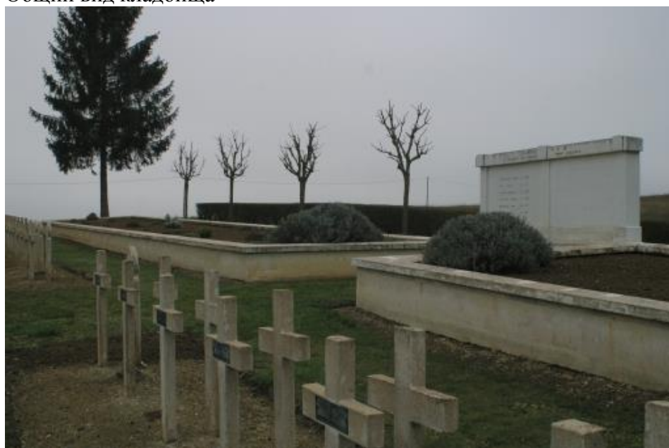
Индивидуальные захоронения и братская могила