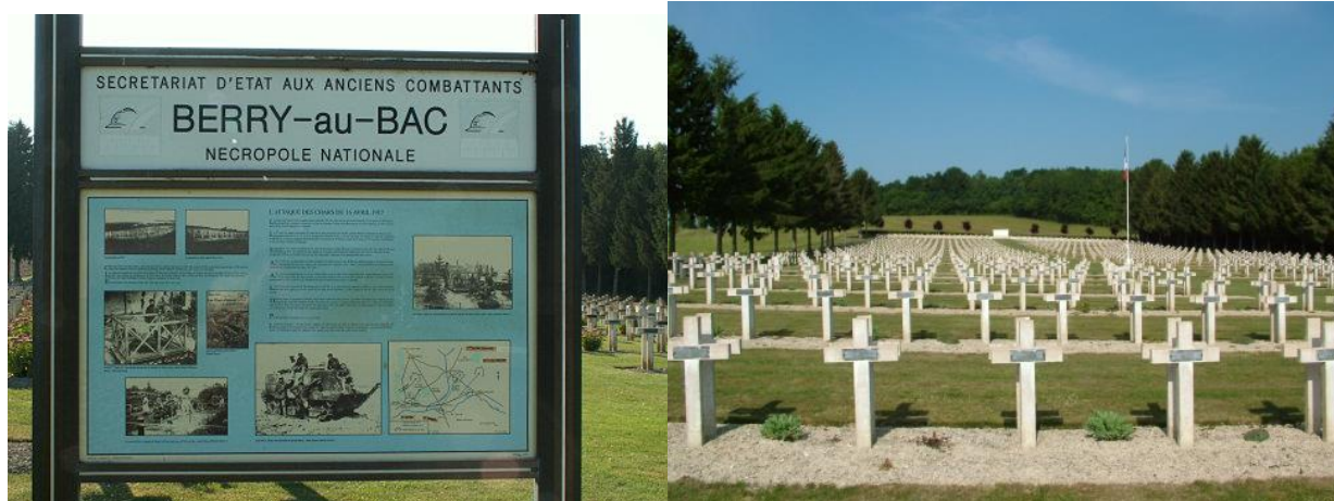
Общий вид кладбища