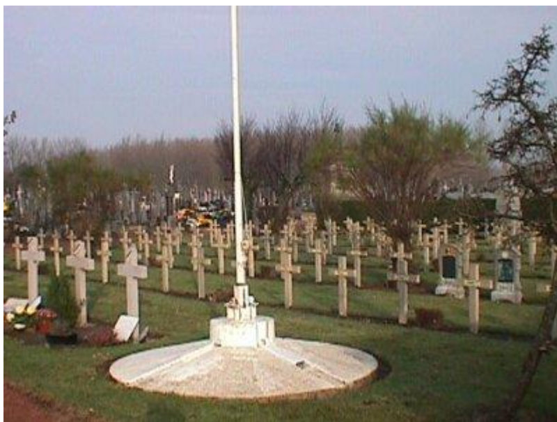
Общий вид кладбища